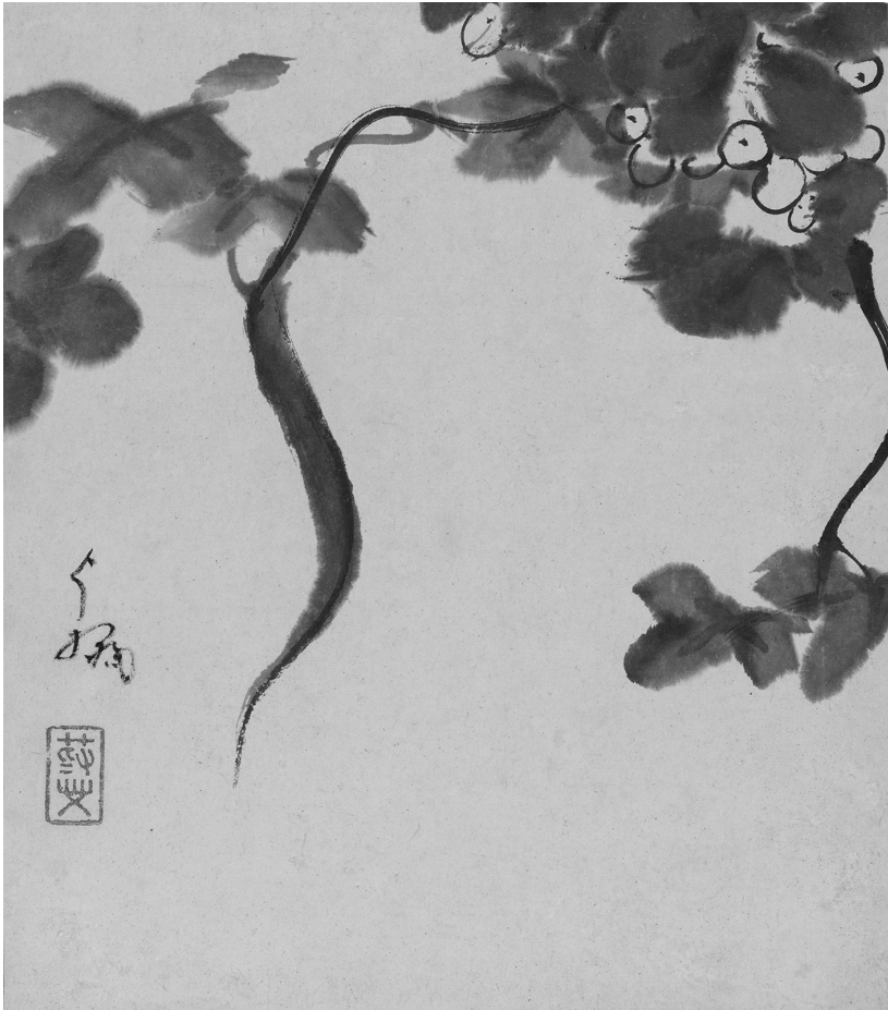
八大人「安晚帖」葡萄図（泉屋博古館蔵）